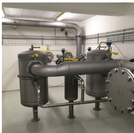
Kondensatbygværk, Vejle rensesanlæg 2019