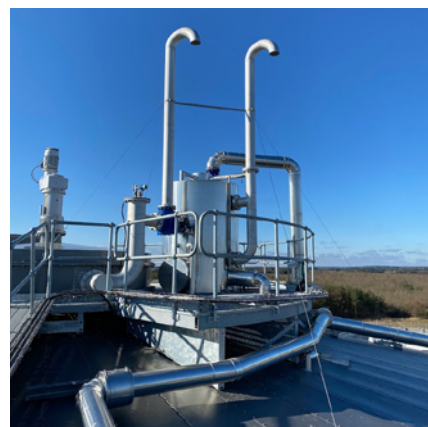
Gasvaskerinstallation, Mariagerfjord Rensningsanlæg 2021