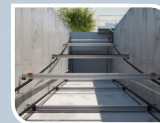
Kædeskrabere af plast fra VA Teknik