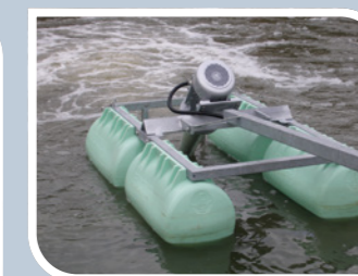
Anlæg til overfladebeluftning fra FUCHS Enprotec GmbH