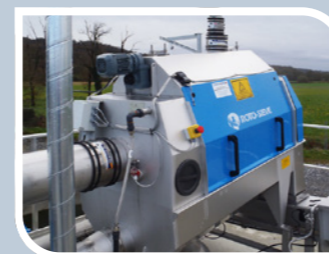
Roto-Sieve® Tromlesi fra Lackeby

Vi har følgende FUCHS Oxystar modeller til udlejning: 1 stk. 15 kW, 230 m 3 /h 1 stk. 18.5 kW, 280 m 3 /h