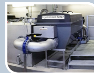
Tromlefilter fra Hydrotech