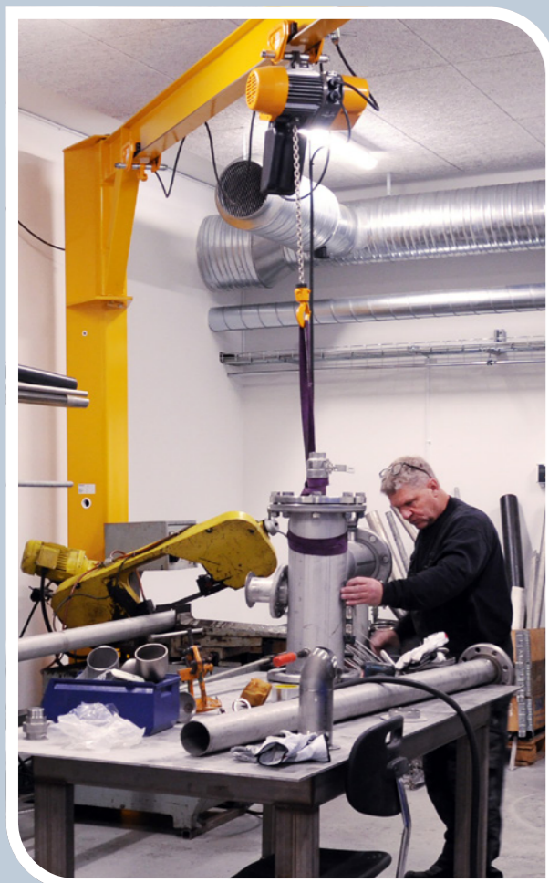
Montering, service og specialfremstilling på eget værksted i Roskilde.